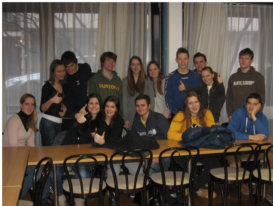
Udeleženci seminarja – 2.b

Seminar je bil organiziran v dveh delih in sicer teoretični ter praktični del.