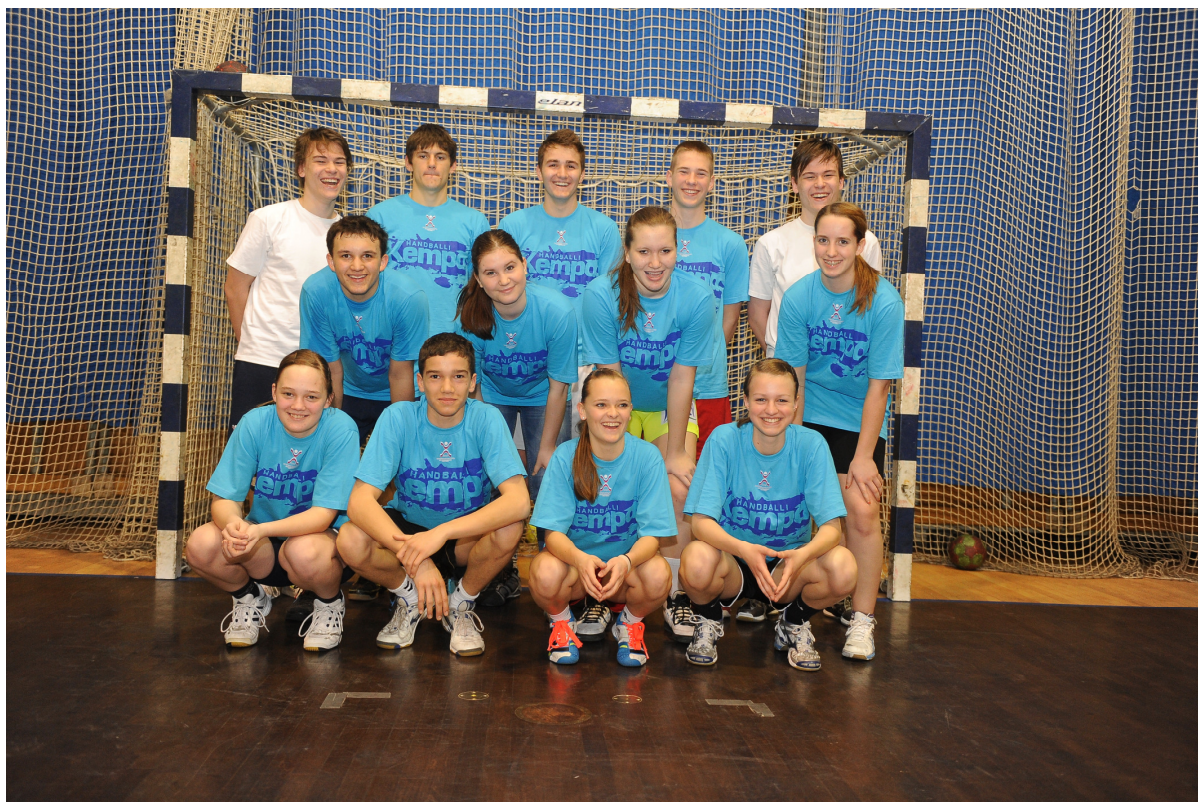
Udeleženci seminarja v Hali Tivoli.

Vsi udeleženci so uspešno opravili izpit.